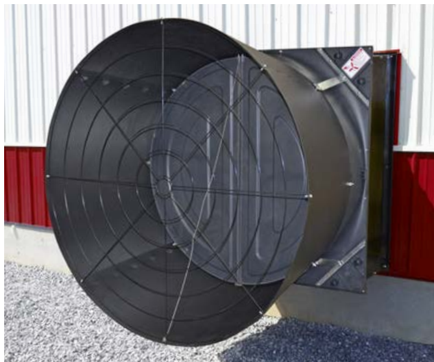
Montaje al ras