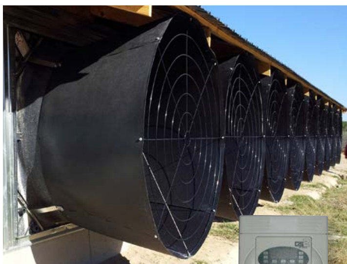
Propulsor de frecuencia variable CHORE-TIME®