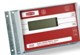
Indicador modelo 100