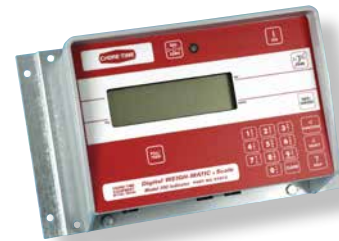
Indicador modelo 200

El sistema digital WEIGH-MATIC® de Chore-Time mantiene un inventario de la cantidad de alimento almacenado en todo momento, sin el uso de un silo de pesaje secundario. El sistema incluye celdas de carga compensadas por temperatura y tiene dos opciones de indicador de balanza digital.