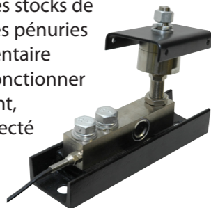
Les cellules de chargement peuvent supporter jusqu'à 4 500 kg (10 000 livres) par pied de silo à aliments.

CHORE-TRONICS® permet une gestion et une surveillance économiques de la nourriture stockée dans les silos à aliments de la ferme. Les producteurs peuvent aisément vérifier les poids des silos à aliments sur un écran de visualisation. En obtenant des mesures précises des poids, ils peuvent améliorer la gestion des stocks de nourriture et éviter de coûteuses pénuries de nourriture. Le système à inventaire pour aliments est conçu pour fonctionner comme un système indépendant, mais peut également être connecté au logiciel C-CENTRAL™ de Chore-Time pour fournir une surveillance à distance d'un ou de plusieurs bâtiments.