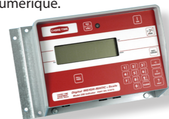
Indicateur modèle 200

conserve en permanence un inventaire de la quantité d'aliments en stock sans avoir à utiliser un silo de pesée secondaire. Le système inclut des cellules de chargement à compensation thermique et possède deux options d'indicateur de balance numérique.