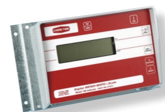
Indicateur modèle 100