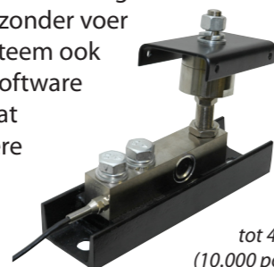
Weegcellen verwerken tot 4500 kg (10.000 pond) per silopoot.

Met ons CHORE-TRONICS®-voervooraadsysteem kunt u het in voersilo's binnen uw bedrijf opgeslagen voer op een zuinige manier distribueren en volgen. Op een informatiescherm kunt u eenvoudig het gewicht van voersilo's controleren. Als u gewichten precies kent, kunt u de voervoorraad beter beheren zodat u geen geld verliest doordat u opeens zonder voer zit. U kunt het voervooraadsysteem ook op de populaire C-CENTRAL™-software van Chore-Time aansluiten zodat u afgelegen locaties en meerdere stallen tegelijkertijd kunt bewaken.