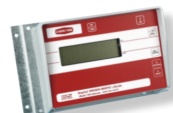
Regelunit voor model 100

Vind uw geautoriseerde onafhankelijke dealer op choretime.com/distributor