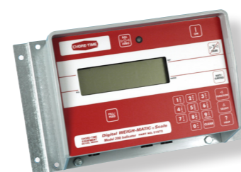
Regelunit voor model 200

Het digitale WEIGH-MATIC®-systeem van Chore-Time houdt altijd de voervoorraad bij, zonder van een secundaire weegsilo gebruik te maken. Het systeem is uitgerust met voor temperatuur compenserende weegcellen en voorzien van twee digitale weegregelunits.